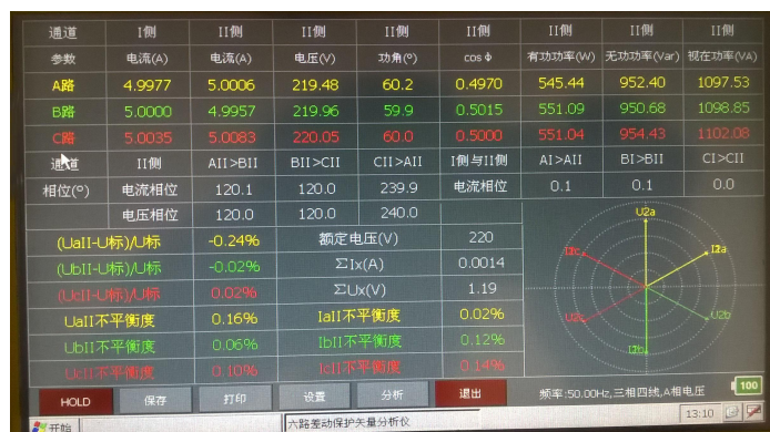
图 1 测试界面

进入测试界面可以看到测试信息，界面底部为操作菜单栏，可进行 HOLD（数据保持）、保存、打印、设置、接线判断、退出操作。