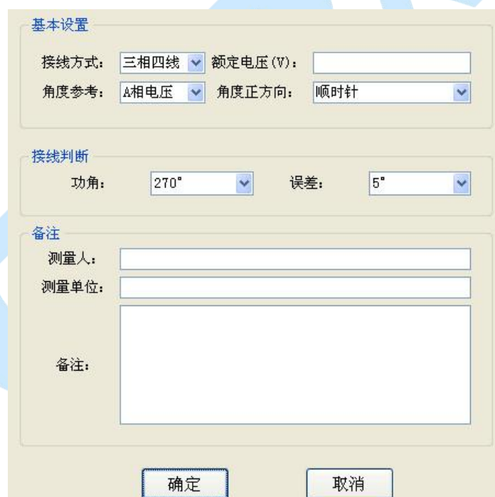
图 6 信息设置界面