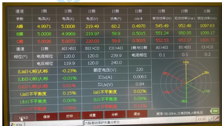
图 5 HOLD 模式界面